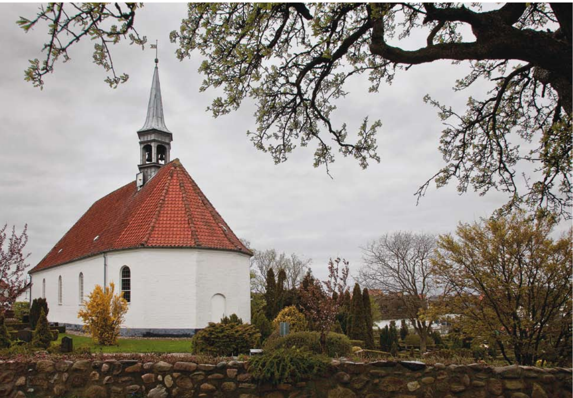
Gilleleje Kirke, 2010. Den 6. oktober 1943 blev over 100 mennesker arresteret ved én razzia i Gilleleje. Langt de fleste havde gemt sig på loftet i kirken.

og det danske kystpoliti afspærrede havnen. Illegal udrejse var forbudt efter dansk lov. Det var alt for åbenlyst, hvad det var, der foregik. En anden berygtet historie fra flugtens dage er en episode i Taarbæk den 9. oktober, hvor en ung flygtningehjælper blev dræbt af et varselsskud. Ved den lejlighed blev 13 personer anholdt, hvoraf fem efterfølgende blev deporteret til Theresienstadt. Men vidneudsagn fra retsopgøret efter 1945 fortæller, at der var temmelig mange mennesker til stede og tegner billedet af livlig aktivitet på havnen sent på aftenen. Skønt den militære undtagelsestilstand og udgangsforbud, som blev indført den 29. august, var ophævet den 6. oktober, var der fortsat forbud mod fritidssejls og uvedkommende færdsel på havnene. Opløbet var meget lidt diskret. Og en stikker ringede til Gestapo. 28