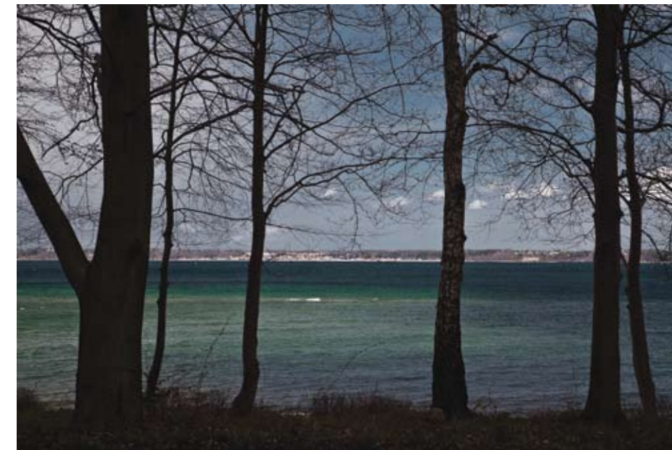
Øresundskysten ved Julebæk Strand, 2010.

Det tjener ikke noget formål at moralisere over fiskernes gerninger. Deres krav om betaling skal ses i forhold til en subjektiv fornemmelse af faren ved sejladsene, risikoen for at miste båden, tabt arbejdsfortjeneste eller endelig risikoen for arrestation – en uvis skæbne, hvor fiskeren ikke ville være i stand til