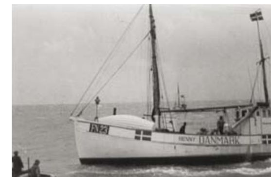
Fiskekutteren FN 23 Henny sejlede i oktober 1943 jøder til Sverige. Fotografiet er fra 1945.

Jo mere man beskæftiger sig med ofrenes synsvinkel, jo tydeligere bliver det, at de netop ikke var passive ofre for besættelsesmagtens overgreb. De var aktive aktører, som tog hånd om deres skæbne; som i al hast gjorde, hvad de kunne for at sikre deres ejendom og ejendele, skaffe de fornødne midler til flugten og organisere deres transport til Sverige. De var ikke passive ofre, som skulle reddes. De handlede selv.