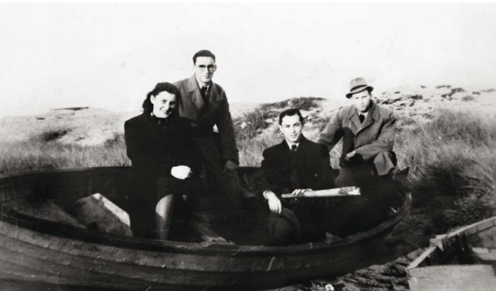
Tre brødre og deres søster fotograferet umiddelbart efter ankomsten til Sverige i en robåd den 6. oktober 1943. De var i alt seks personer i båden. Den ene åre knækkede tæt på den svenske kyst.

at forsørge sin familie. Det var principielt faste udgifter, som fiskerne skulle forsikre sig imod ved at modtage betaling. Men man skal notere sig, at priserne netop ikke var faste. De blev bestemt af markedsmekanismerne – udbud og efterspørgsel.