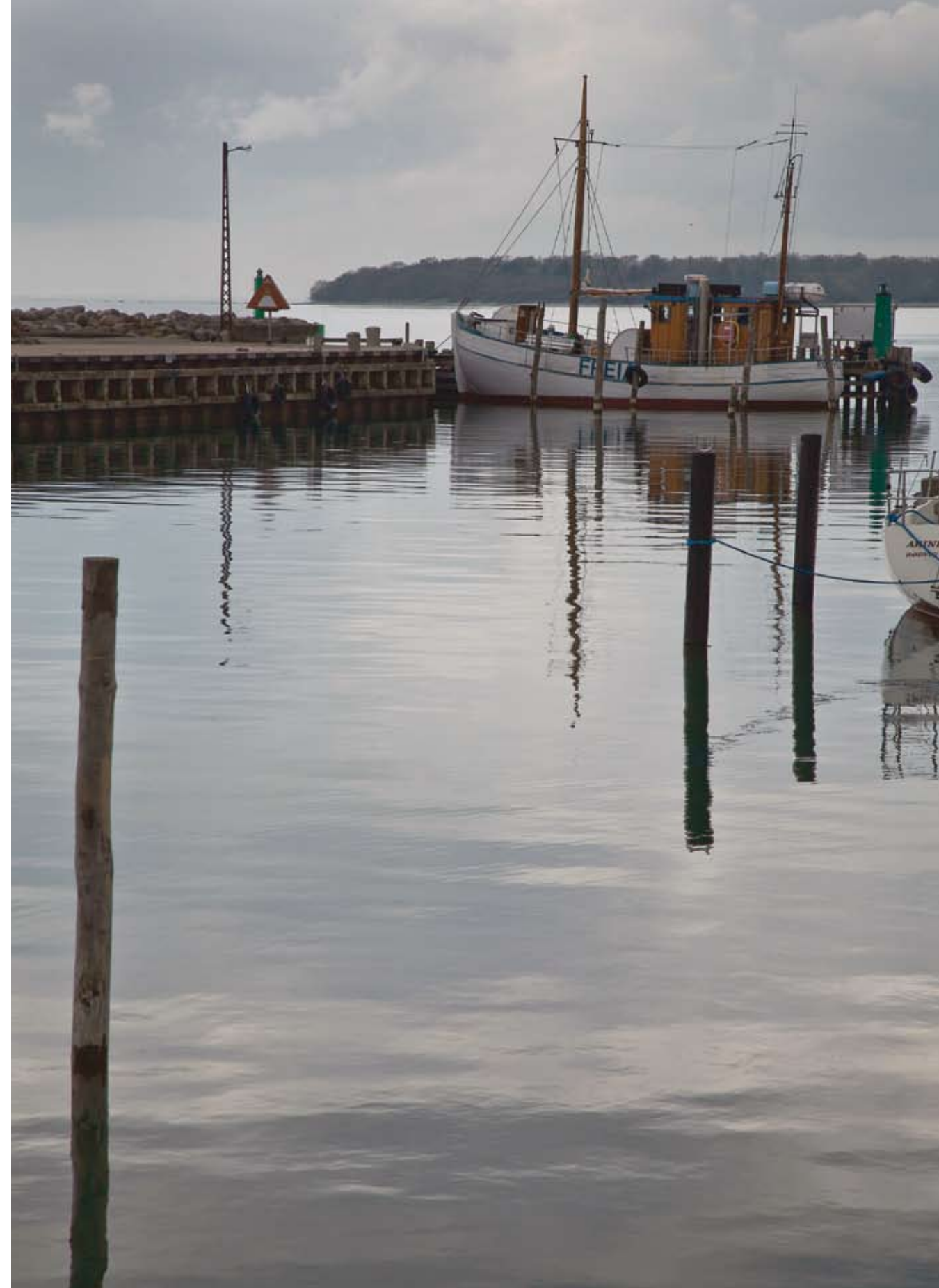
Havnen i Rødvig, 2010.

Alternativet til flugt var at gå under jorden. Det betød et liv i illegalitet uden penge og ratione-