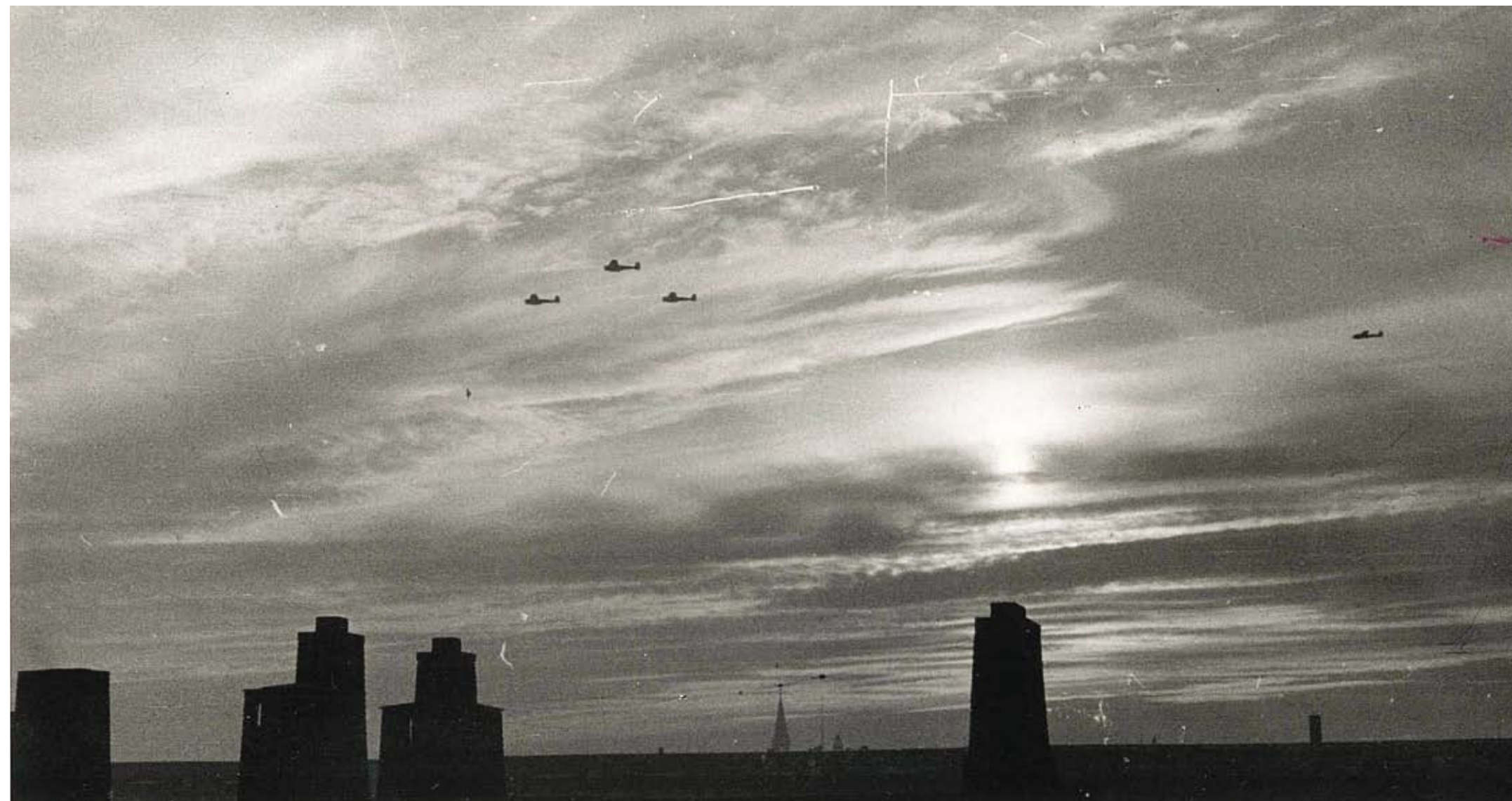
Tyske flyvemaskiner flyver ind over København den 9. april 1940. Fotografiet er taget af en dansk jøde, som så flyvemaskinerne fra sin lejlighed i indre by (Dansk Jødisk Museum).

De tyske besættelsesmyndigheder accepterede, at løftet den 9. april 1940 om ikke at "antaste kongeriget Danmarks territoriale integritet eller politiske uafhængighed" omfattede de danske jøders