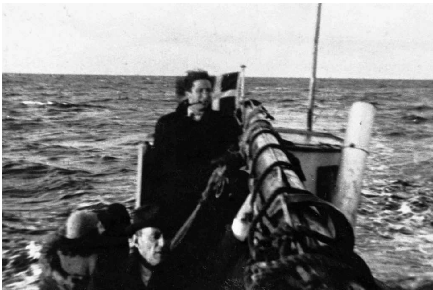
יהודים על סירה מדנמרק לשבדיה ספטמבר 1943

בראש השנה תש"ד החל מבצע הצלה עממי | רבבות אזרחים דנים התגייסו לחלץ את שכניהם היהודים מציפורני השלטון הנאצי שכבש את ארצם | כ- 7,000 יהודים הוברחו לשבדיה השכנה הניטרלית, וניצלו