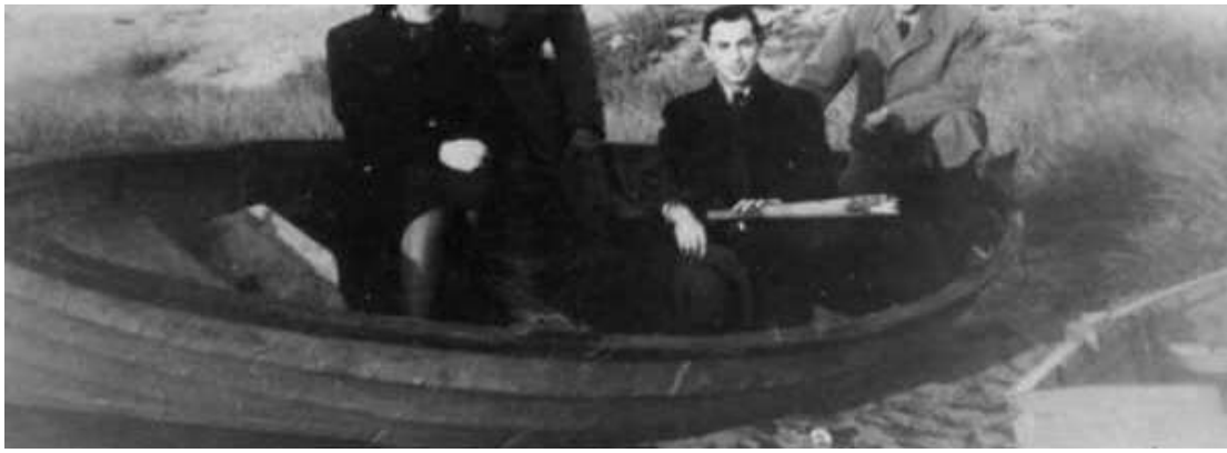
יהודים מגיעים לשבדיה לאחר שהוברחו מדנמרק על ידי המחתרת הדנית. 6 באוקטובר 1943

העברתם של 7,000 יהודים דרך הים הצפוני לעבר שבדיה ארכה כמה חודשים. ממקומות המסתור הוברחו היהודים לנמלים ולחופים במוניות, משאיות, כרכרות ורכבים פרטיים. מאות דנים השתתפו בפרויקט התעבורה היבשתי ובעזרת מאות נהגי מוניות שהתנדבו למשימה, הוברחו היהודים ממקומות המסתור לחוף הים. בחופים המתינו להם אניות מסחר וסירות דייגים שנשכרו ונקנו על מנת להעבירם לשבדיה הניטרלית. בשעות לילה, תחת עינן של המשחתות הגרמניות הרבות בים הצפוני, האוניות חצו את הים. בכל לילה בו תנאי מזג האוויר אפשרו זאת יצאו כתריסר סירות עמוסות יהודים עד סף הקיבולת. לאחר למעלה מ-600 הפלגות – הובלו כל היהודים בבטחה לשוודיה.