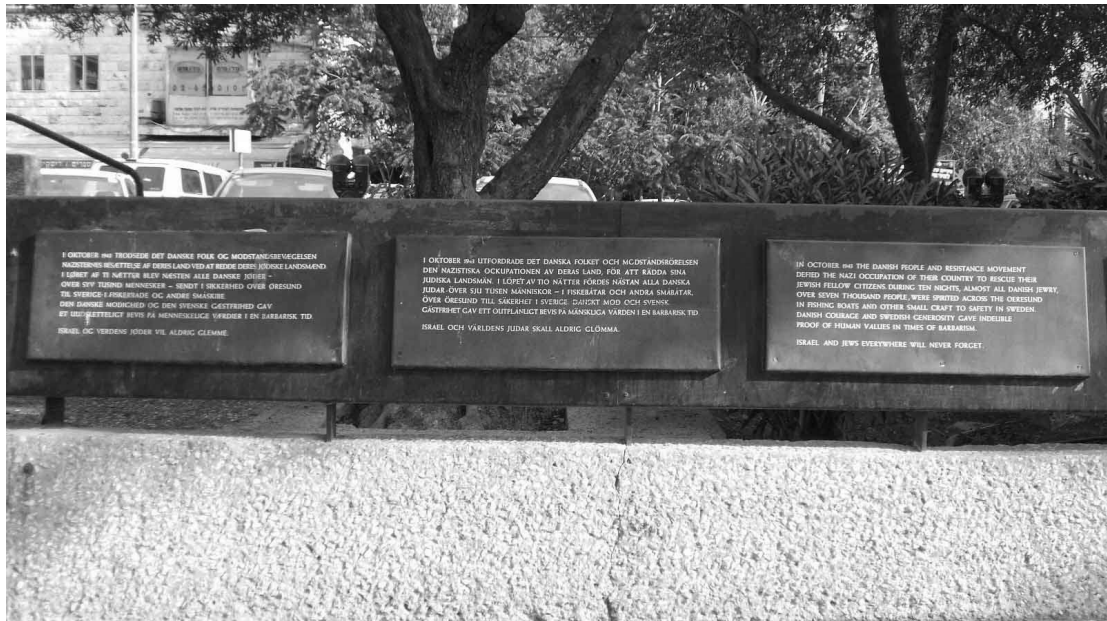
אנדטרת לזכר יהודי דנמרק בכיכר דנמרק בירושלים

בכל מדינה אחרת שעמדה תחת הכיבוש הנאצי המנהל הזה היה נזכר כחסיד אומות עולם, והתנהגותו הייתה לאות ומופת לדורות הבאים. בדנמרק, המנהל הזה פעל בדיוק כמו רבבות דנים אחרים ועל כן – נותר אנונימי.